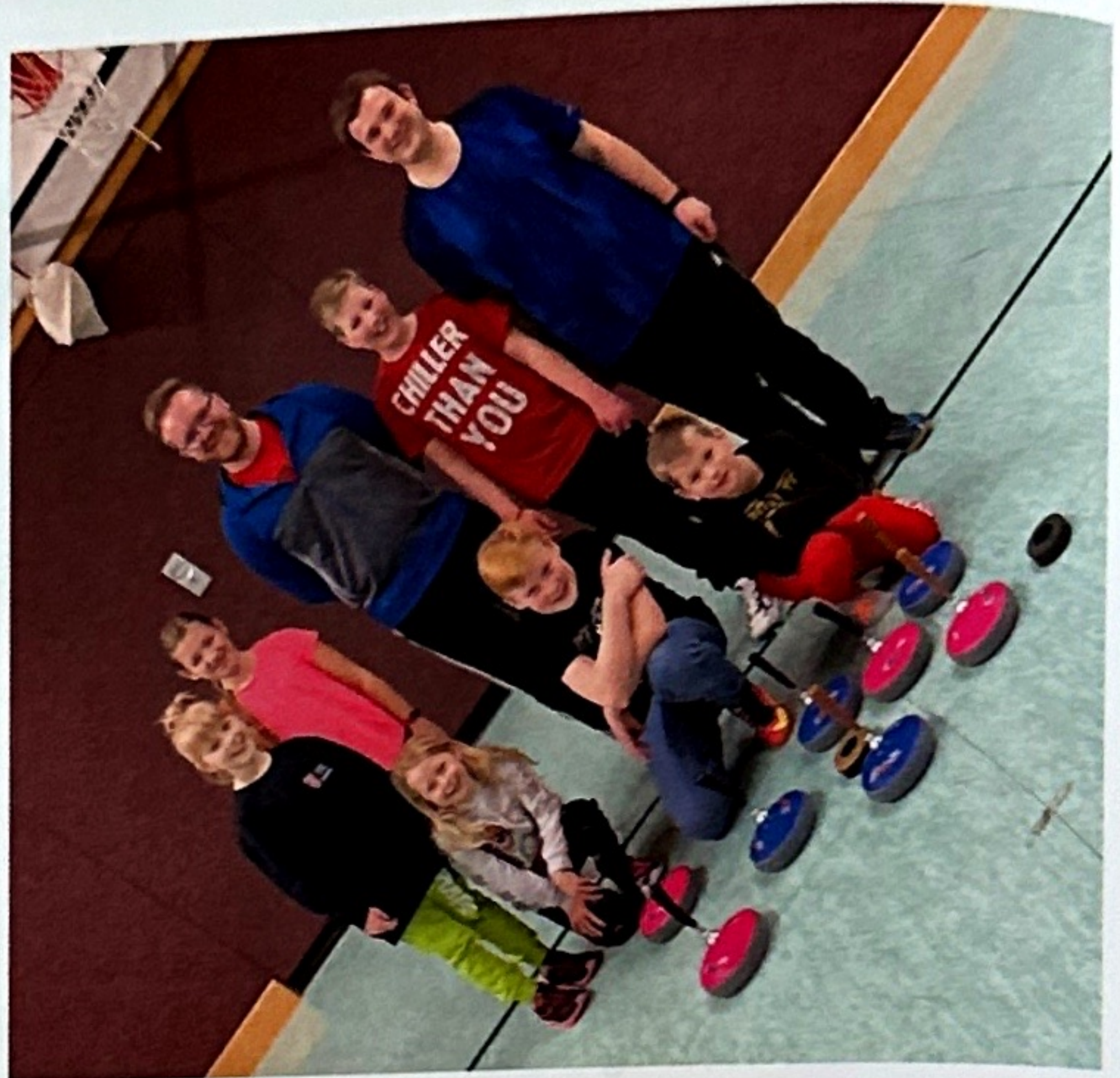
Bild 5: Auch die jungen Schützen dürfen mit bunten Stöckern auf Punktejagd gehen.

Nicht nur die Kinder- und Jugendprogramme bringen den Lokalsport ins Gespräch. Es sind auch die sportlichen Erfolge. Am 12.01.2020 startete der Wettkampf in der 1. Bundesliga in der Eishalle in Waldkirchen. Der Kader erkämpfte sich hierbei den 15. Platz von 28 und verbuchte einen guten Start in der obersten Klasse. (Bild 6)