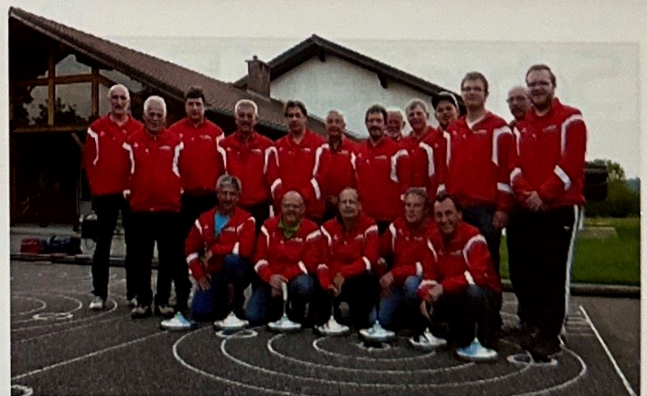
Bild 3: Zur Fusion zum SV Truchtlaching-Seeon gabs natürlich auch eine frische Team-Ausstattung.