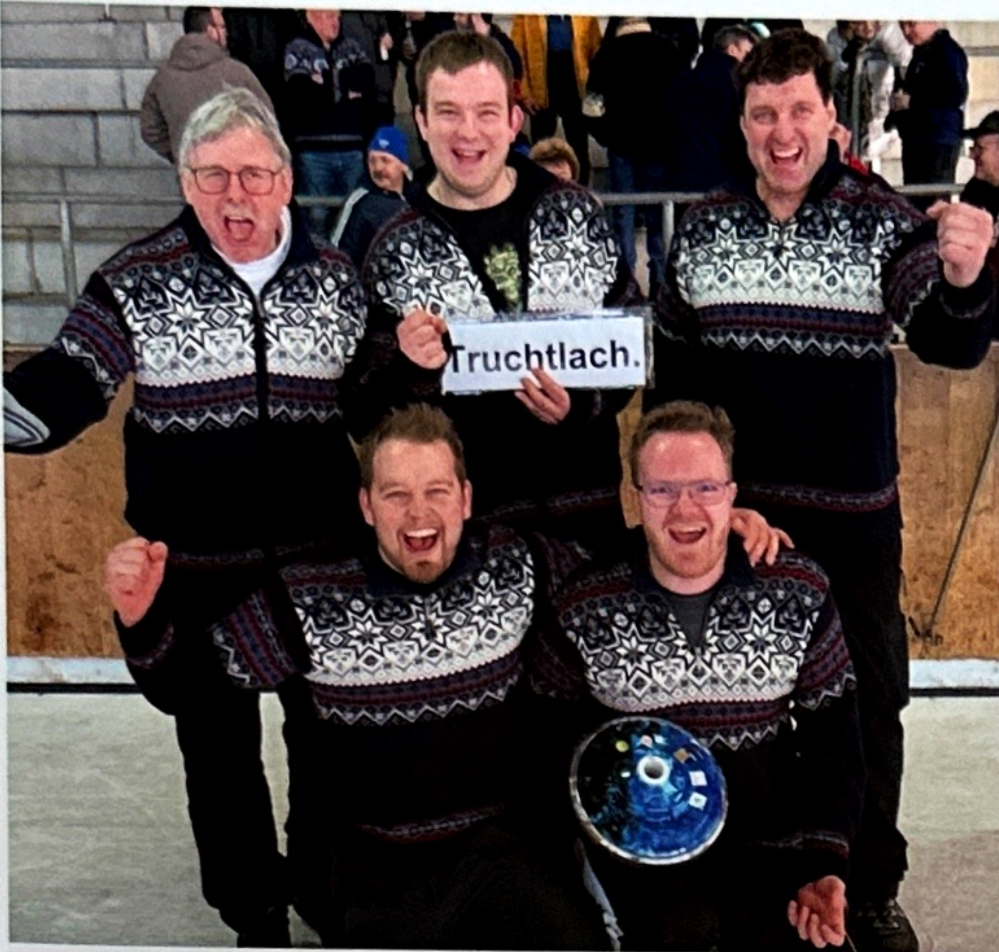
Bild 6: Endlich 1. Liga. Die Freude der Spielergemeinschaft war riesengroß.