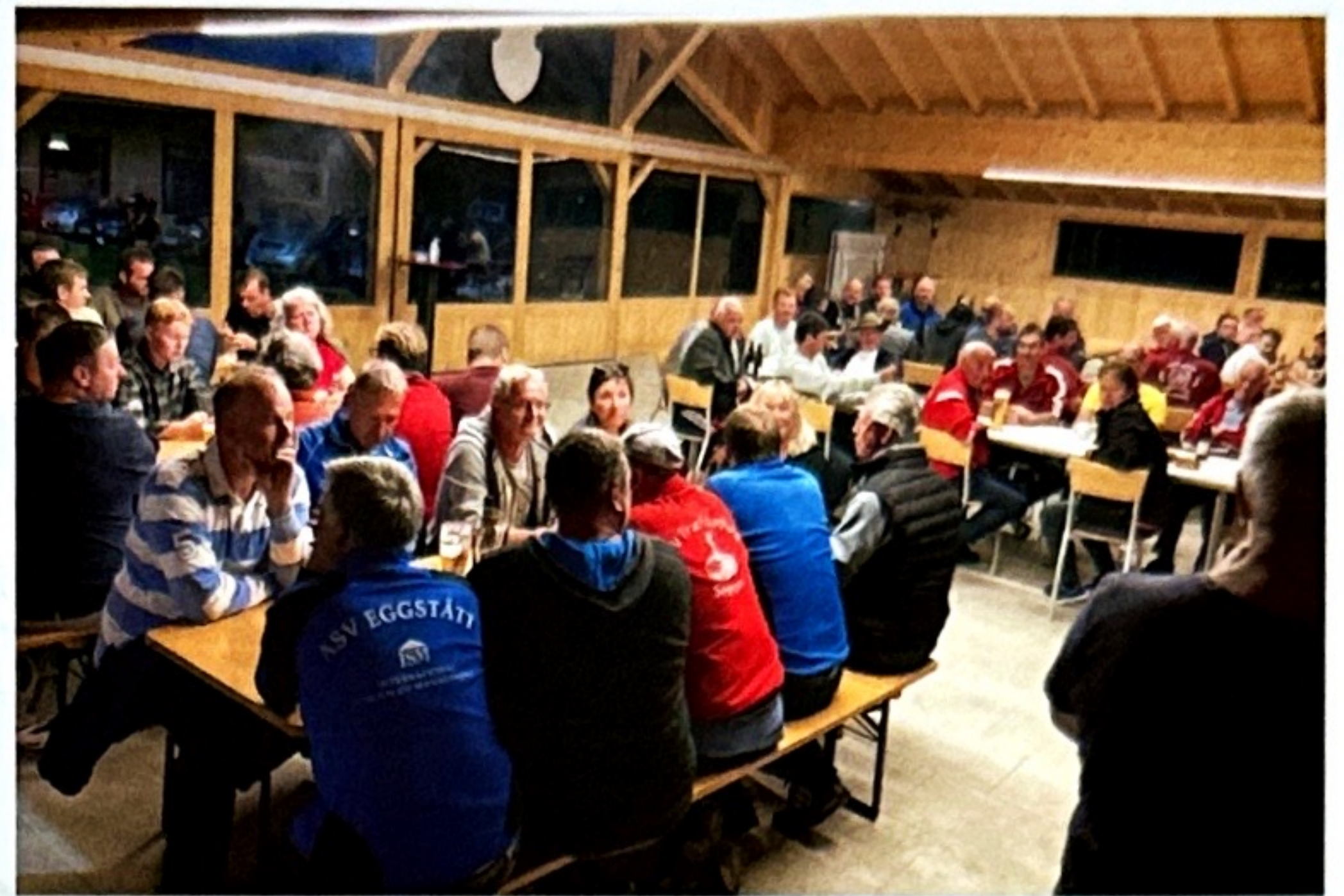
Bild 7: Die jährliche Dorfmeisterschaft erfreut sich auch jedes Mal großer Begeisterung.

Weiterhin werden nationale Einladungsturniere gespielt, sowie auch in Österreich und in der Schweiz.