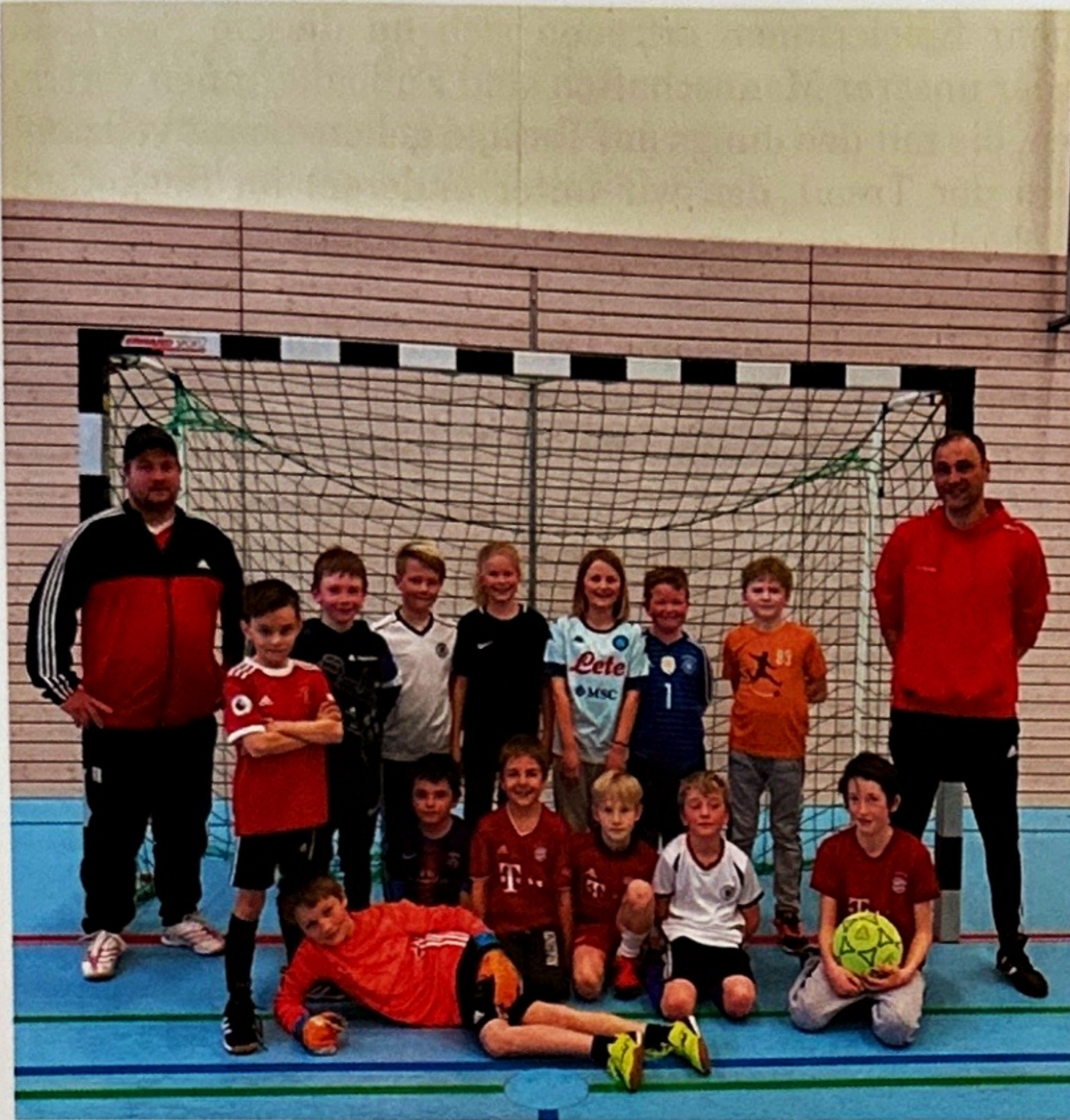
Auch die F-Jugend geht gestärkt ins neue Jahr.

Im Sommer wird wieder zweimal die Woche am Sportgelände trainiert.