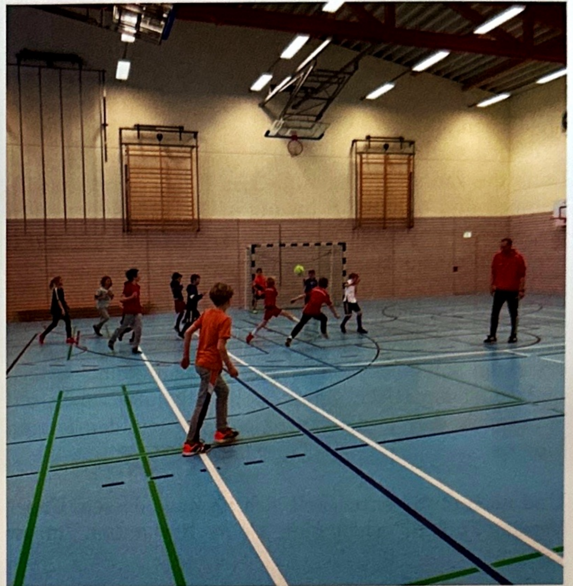
Im Winter in der Halle, im Sommer dann endlich der Freiplatz.

Grundlagen der Ballführung, Technik und Trainingsmatches sind die wichtigen Pfeiler beider Gruppen. Hier erfreuen wir uns am Team-Building und dem Zusammenhalt der Gruppe, die auf dem Platz zu neuen Freundschaften führt und somit teil vieler Erfolge ist. Dies unterstützen wir. Wegen der langen Spielpausen wurden beide Gruppen (F1 und F2) zum Wiener Libella-Turnier angemeldet, um ihnen zeitnah Spielfreude und Spaß zu bieten, neben der noch zu spielenden Rückrunde.