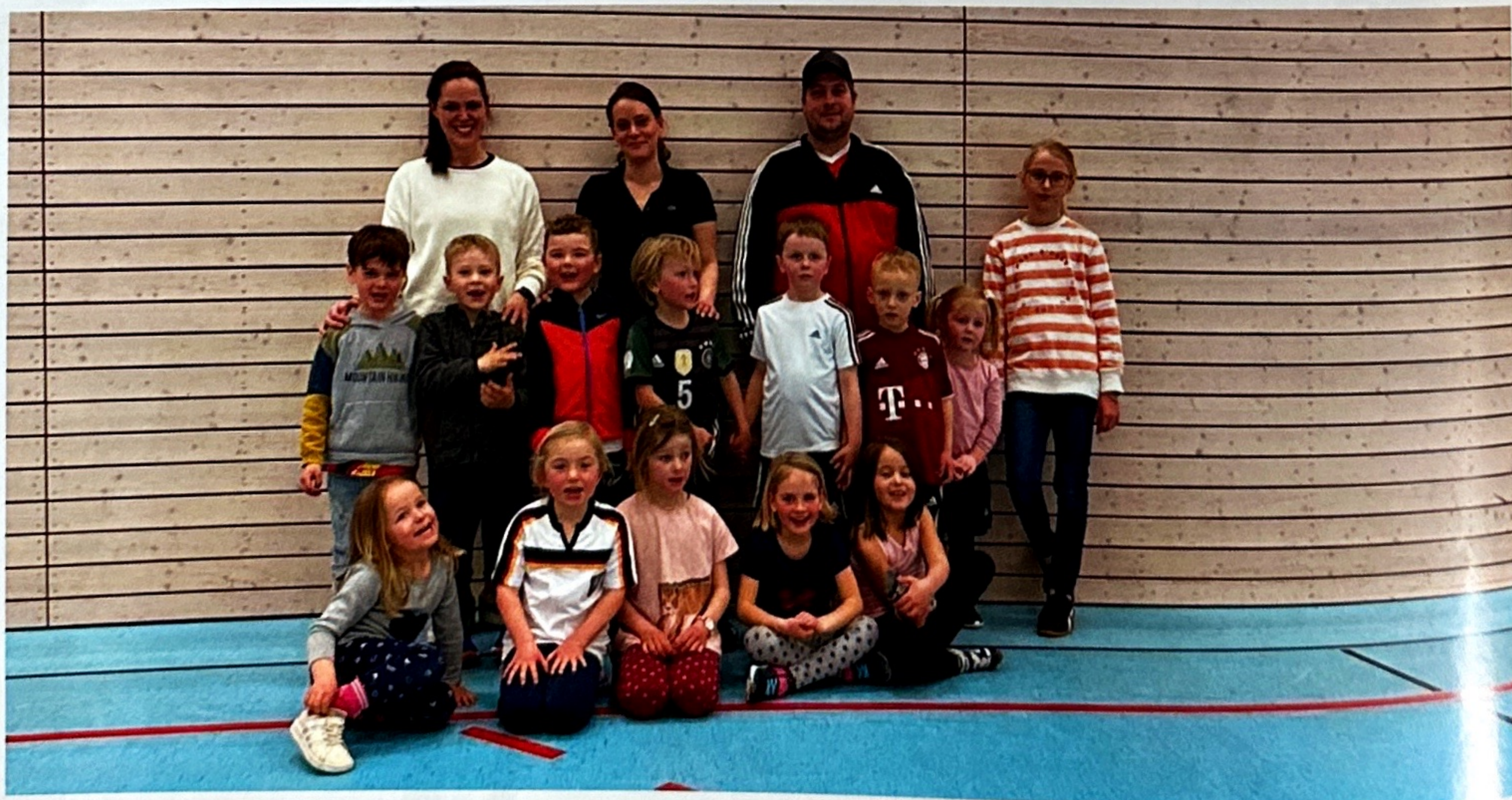
Die Bambini legen seit 2021 richtig los.