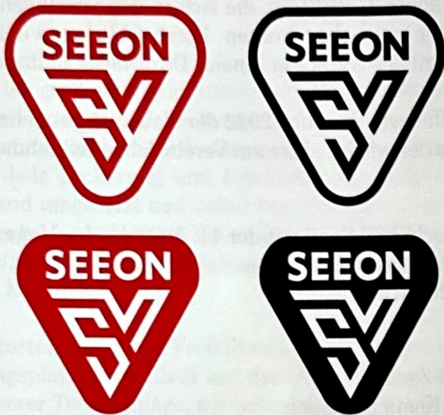
Variationen des SV Seeon Logos für diverse Zwecke.

Der SV Seeon präsentiert im Jahr 2022 ein neues Logo und möchte damit einen modernen Weg einschlagen. Hierbei spielt die Außenwirkung eine Rolle, bei der ein markantes Logo mit starker Wiedererkennung wichtig ist. Diesen Trend verfolgen schon viele Profi-Vereine, sodass auch für den SV Seeon dieser Trend eine bedeutende Rolle einnimmt. Das Logo hebt sich vom Vereins-Wappen ab und soll gegenüber Diesem ein Statement abgeben: Dynamisch und selbstbewusst, modern und nach vorne blickend, wahrnehmbar und direkt. Diese Aspekte sind es, die viele unserer Mitglieder des Vereins verkörpern, gerade die jungen Sportler (ca. 300 Mitglieder unter 18 Jahre).